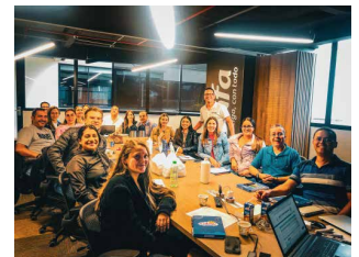
Manizales, Colombia Entrenamiento en FDA, Industria Láctea CELEMA, Marzo 2023

Legislación alimentaria FDA en 21 CFR 101 Food Labeling y Unión Europea