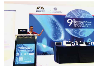
México City 9th International Symposium on Probiotics, Abril 2023

TESOEM - Tecnológico de Estudios Superiores del Oriente del Estado de México, julio 2019